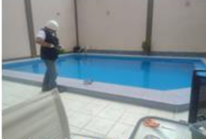
Vigilancia para determinar la calificación sanitaria de piscina Empresa turística GM S.A.C