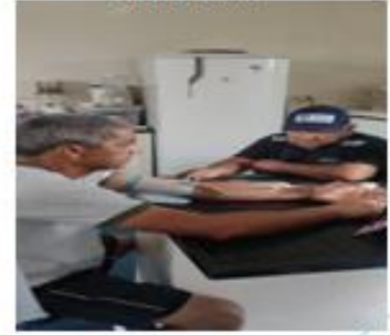
Libre Platica CONVOY Brasileiro R/M CT-32