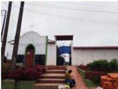
Vigilancia Sanitaria del Cementerio de Nauta