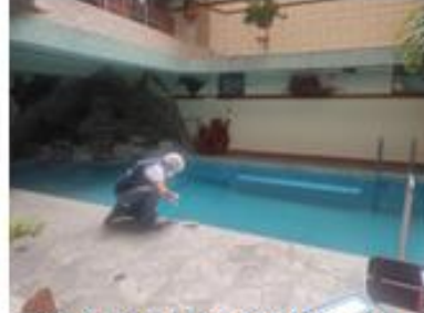
Vigilancia para determinar la calificación sanitaria de piscina Ventura Isabel SAC