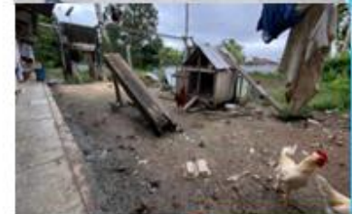
Evaluación de riesgo por casos de leptospirosis en la localidad de Barrio Florido distrito de Punchana