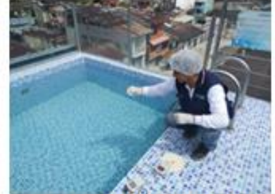
Vigilancia para determinar la calificación sanitaria de piscina Nativo Hotel EIRL